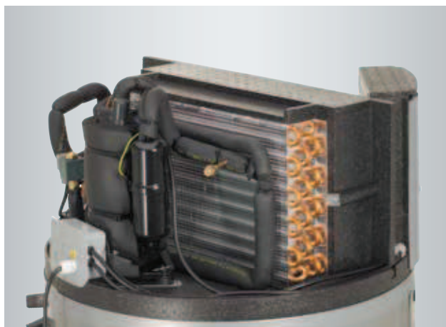
Bovenste gedeelte Vitocal 160 A

Via de zeer eenvoudig te bedienen regeling met groot display kunnen de verschillende programma's gemakkelijk ingesteld worden. Warmwaterbereiding, permanente werking of standby-werking – al deze functies kunnen geactiveerd worden met een beperkt aantal functietoetsen.